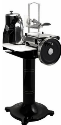
Retro AM330 - Black